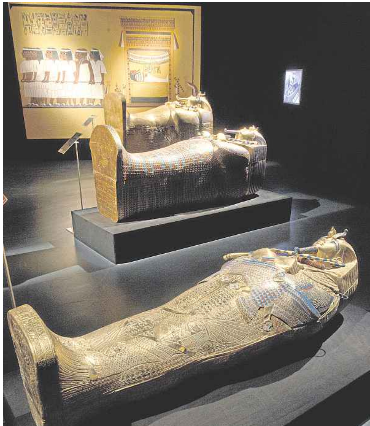
Drei ursprünglich ineinander verschachtelte goldene Särge.

Im Tal der Könige kann man auch die in Leinen gehüllte Mumie Tutanchamuns in Augenschein nehmen. Sie soll gut bewacht hier an ihrem angestammten Ort bleiben. Eine Nachbildung krönt die Ausstellung in Ludwigsburg. Sie erzählt aber nicht nur von den alten Ägyptern, sondern